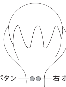
左ボタン 右ボタン